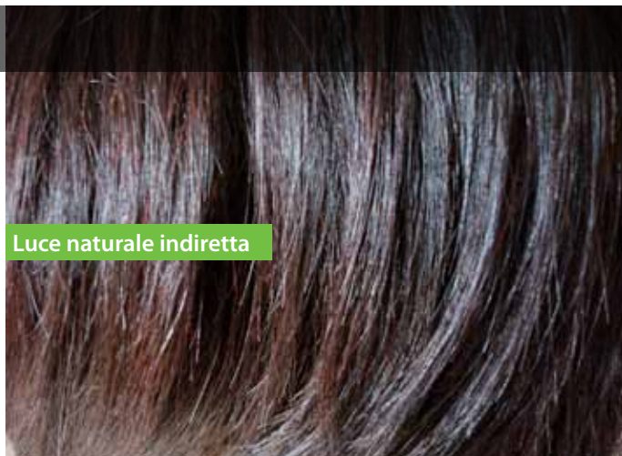
Luce naturale indiretta